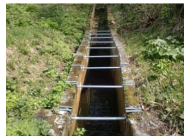
（平成29年5月 応急対策後）