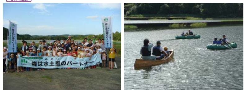
イベントには毎年50名以上が参加 カヌー遊びなど、ため池を地域住民へ開放

「おおぞらと美しい幌（むら）のもとで『水と土と里を繋ぎ地域を守る』」ことを基本理念に、役職員においては、地域住民の要請、時代の要請に応えるための自己確認、自己改革に取り組むとともに、地域住民・地域社会と連携した先駆的な農業振興活動、多様な広報の展開を柱に、この運動を展開していくこととしている。